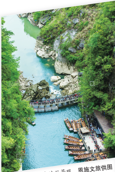
湖北恩施屏山大峡谷景观。