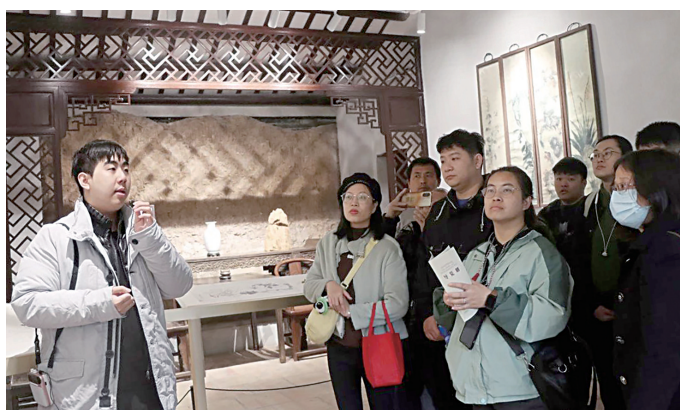
▲广州市海珠区工会“增三性”主题活动现场。