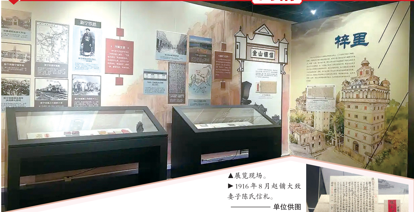
▲展览现场。 ▶1916年8月赵镛大致妻子陈氏信札。