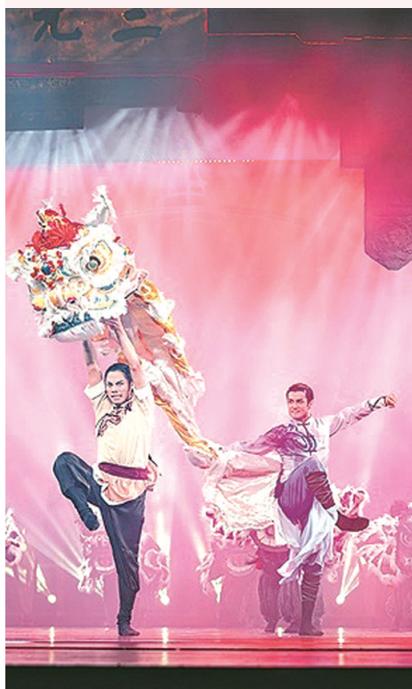
■舞剧《醒·狮》剧照。

由国家艺术基金重点扶持、广州歌舞剧院创排的舞剧《醒·狮》2026年全国巡演近日开幕。据悉,这部在2025年摘得我国专业舞台艺术领域政府最高奖文华剧目奖的作品将于1月24日—28日登陆红线女大剧院,为广州街坊带来专属的艺术盛宴。