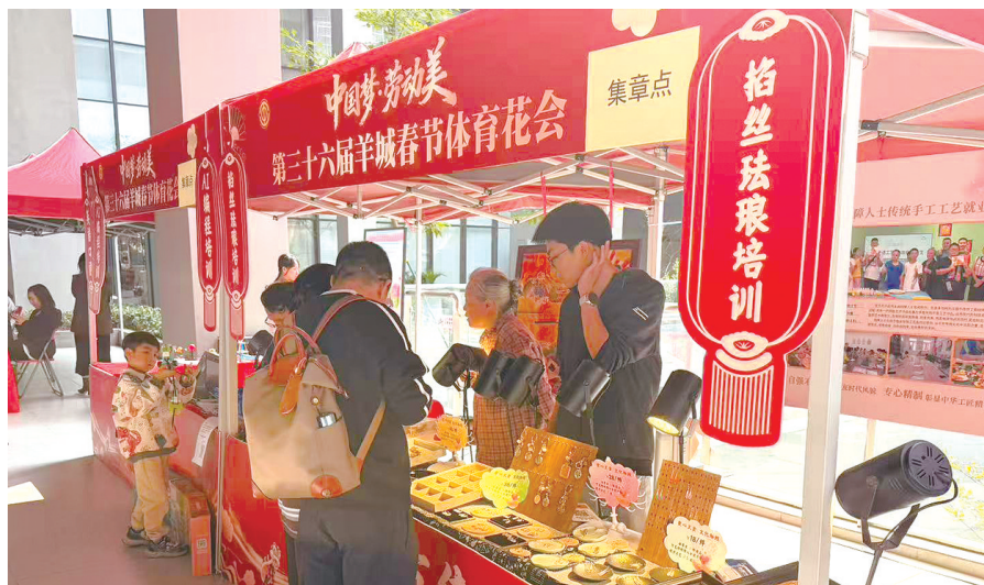
■趣味手工等特色摊位吸引职工驻足观看。

市二宫文化广场上,非遗体验、趣味手工等以技艺互动为特色的摊位错落有致,民俗底蕴与工匠趣味融合,吸引众多职工及家人参与。最受欢迎的莫过于挥春摊位。多位书法家现场挥毫,一幅幅吉祥春联、一个个饱满“福”字跃然纸上。职工或驻足欣赏,或有序排队领取,墨香伴